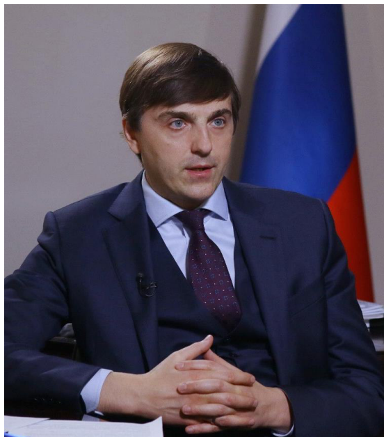
Министр просвещения Российской Федерации С.С. Кравцов

«Мы ... продолжаем общий мониторинг работы школ в части качества питания... Мониторинг позволяет отслеживать ... массу блюд по приемам пищи в среднем по регионам, а также калорийность завтраков и их отклонение от нормы. Он осуществляется на базе специально созданной цифровой платформы автоматизированного мониторинга питания, в которой уже зарегистрировано более 35 696, или свыше 91%, общеобразовательных организаций, и мы видим практически ежедневную динамику...»